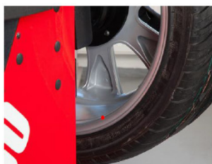
Laser pro lepící závaží